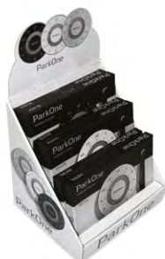
Display 3 farver