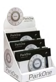
Display 1 farve

Der kan også udarbejdes salgs- og marketingmateriale med eget logo inkorporeret.